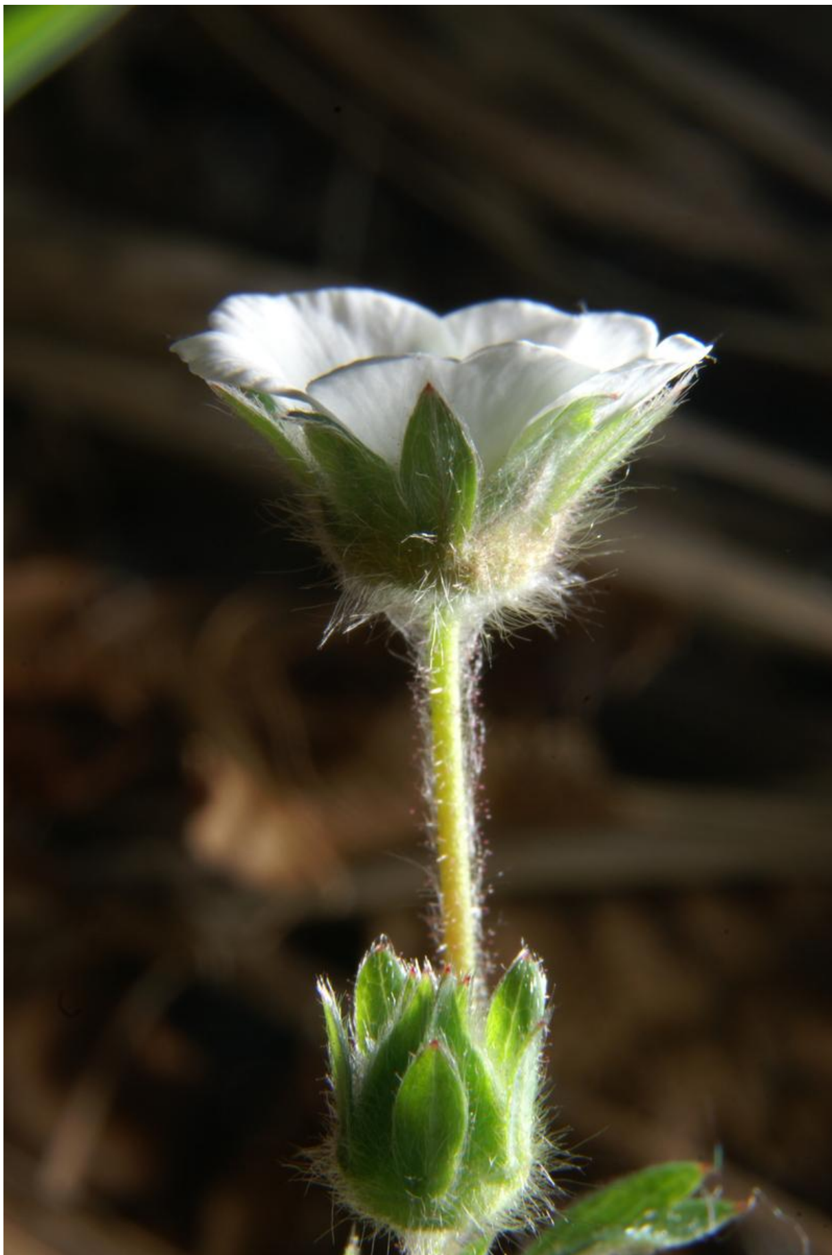
Slika 4