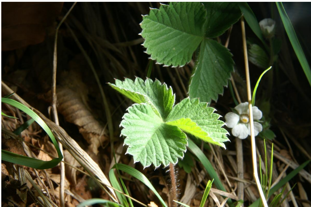
Slika 1

Opis vrste : trajnica za koju je karakteristično da nema vriježa ( stolona ) tj. puzavih stabljičica, a može narasti do 10 cm visine. Listovi su trodjelni sa dugačkim lisnim peteljkaama koji su duži od cvjetne stabljike ( Slika 1 ) . Po obliku listovi su lancetasti ili jajasti i nazubljeni, na vrhovima su bodljikave izrasline dužine od 3-5 cm obrasli brojnim žljezdanim dlačicama, cvjetovi su dvospolni bijeli sa 5 lapova i latica koje su duže od lapova i koje čine dvostruko ocvjeće ( Slike 2 i 3 ).