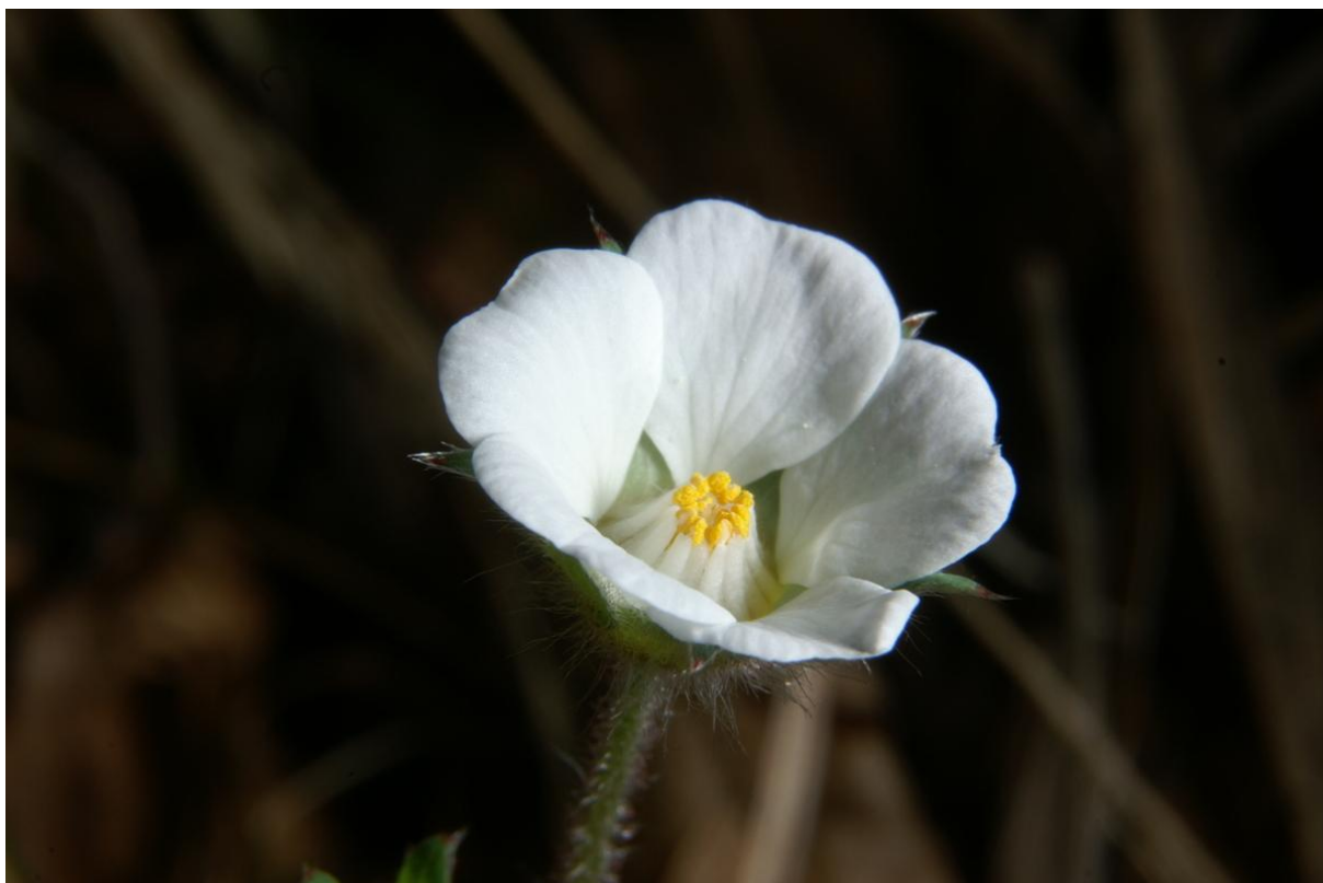
Slika 2

Prašnika ima mnogo, a plod nakon sazrijevanja nije mesnat.